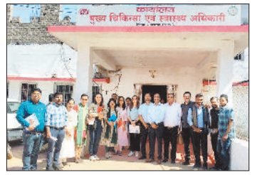
टाइप-1 डायबीटीज पर कार्यवाही: विशेषज्ञों ने टी जानकारी